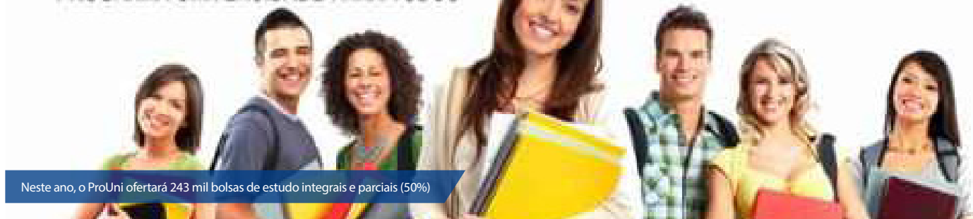
Neste ano, o ProUni ofertará 243 mil bolsas de estudo integrais e parciais (50%)