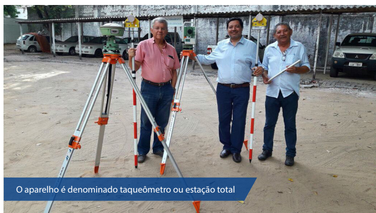
O aparelho é denominado taqueômetro ou estação total