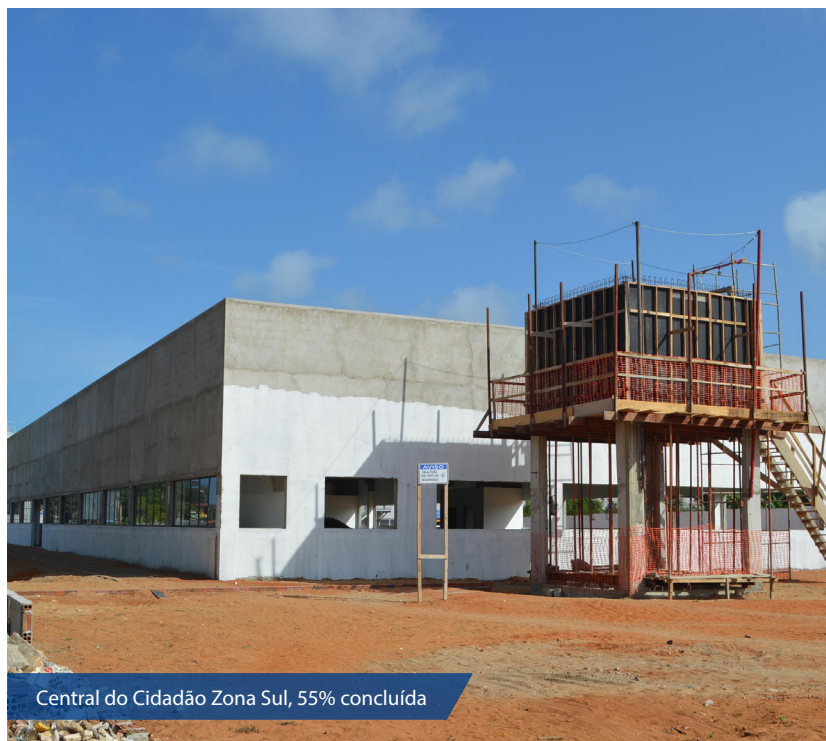
Central do Cidadão Zona Sul, 55% concluída